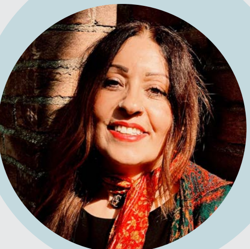
MARA GENTILE Attrice